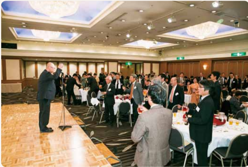
140名の同窓生が集った昨年の懇親会

同窓会定期総会・懇親会を10月21日(土)札幌全日空ホテルにて開催いたします。総会後の懇親会では、招待教員のスピーチや学長からの大学・短大部の近況報告、今年度の同窓会奨励生の挨拶、各支部からの報告も行われます。また、旧教職員や現教職員も多数出席予定です。例年好評の在学生のサークルによるアトラクションを今年も予定しています。