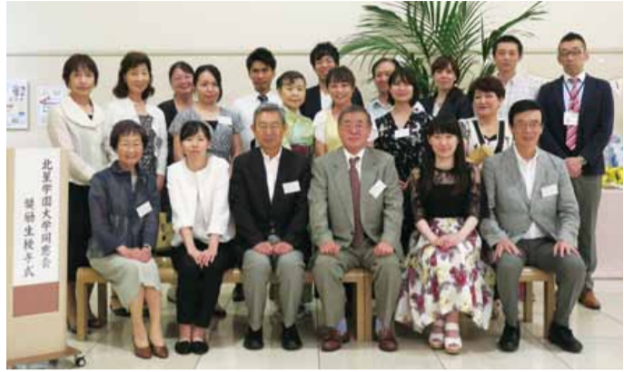
奨励金授与式会場にて

いによって、私自身も受け身ではなく主体的な姿勢で積極的に学内だけでなくアジアと中心に様々な国に行きました。そこでたくさんの子どもたちと出会い今まで知らなかった過酷な現状を知り、子どもたちがもつと生き生きと生活ができるようにしたいというビジョンができました