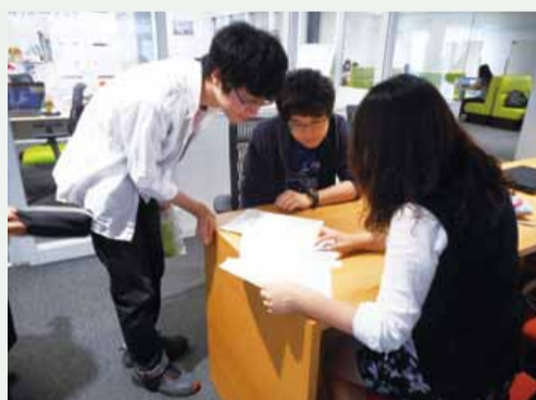
北星ピア・サポーターによる学習支援