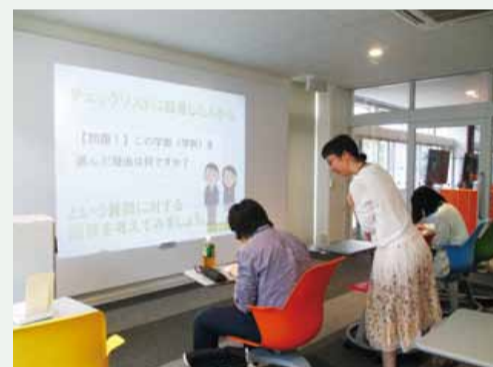
学習セミナーは少人数制で楽しく学ぶ