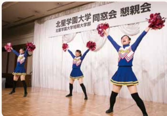
チアダンス部 STARRYS によるアトラクション