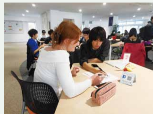
留学生と一緒に勉強