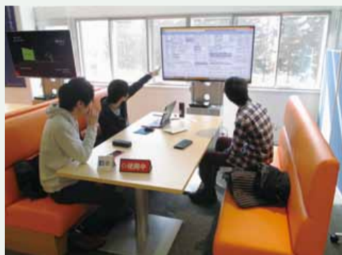
モニターを使った打合せ グループ学習に最適

本センターでは、目まぐるしく変化する時代に対応する人材を育成するために、従来の学びから、一歩先に進んだ新しい学びを支援していると言えます。本学での「学び」をより充実したものにしていくために、日々努めています。