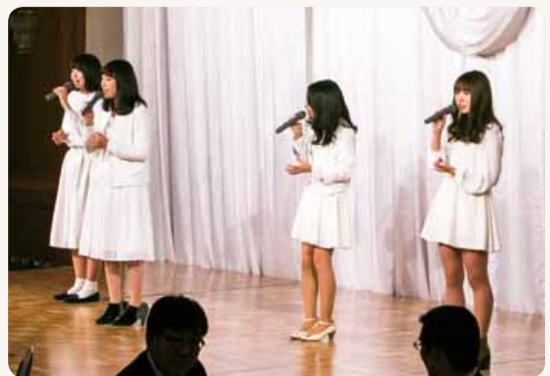
アカペラサークルぼらりす. によるアトラクション