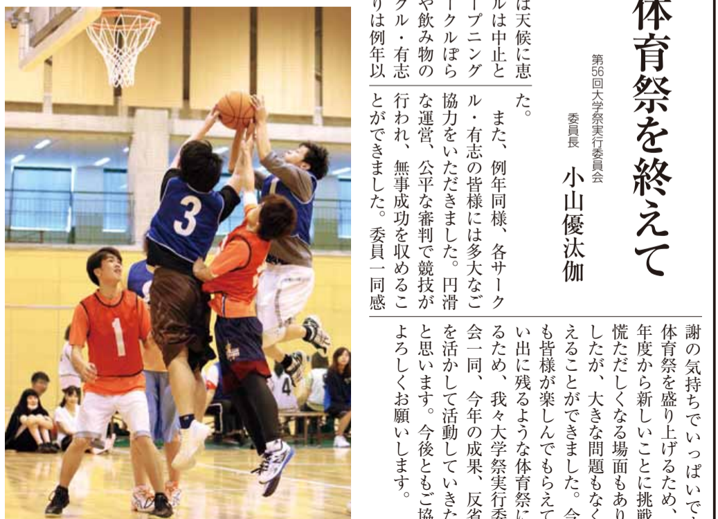
バスケットボールの試合

分科会では、小グループに分かれて、同窓生から短大卒業後のキャリアや現在の仕事の様子、また海外経験の話などを聴きました。在学生にとっては将来のキャリア・パスを考える良い機会となりました。イベントの最後には、センター棟1階国際ラウンジにて懇親会が行われ、交流を深めました。