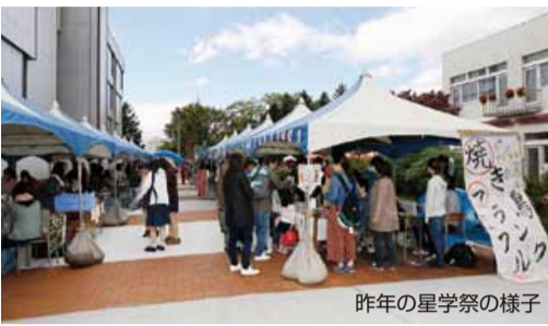
昨年の星学祭の様子

星学祭は一般公開されますので、ご家族やご友人の方々をお誘いあわせの上、ぜひお越しください。なお、詳細なスケジュールについては、大学公式HPにてご案内いたしますのでご確認ください。多くの皆様のお越しをお待ちしています。