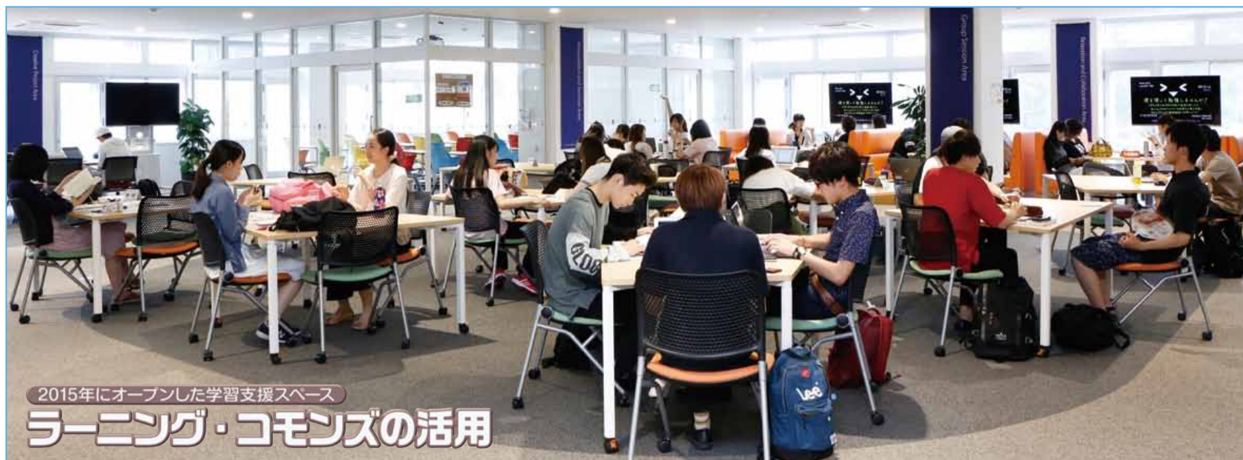
2015年にオープンした学習支援スペース ラーニング・コモンスの活用