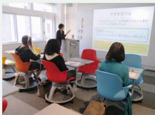
スタディスキルを身につける学習セミナー