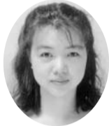
中谷 郁子 (ヴァイオリン)