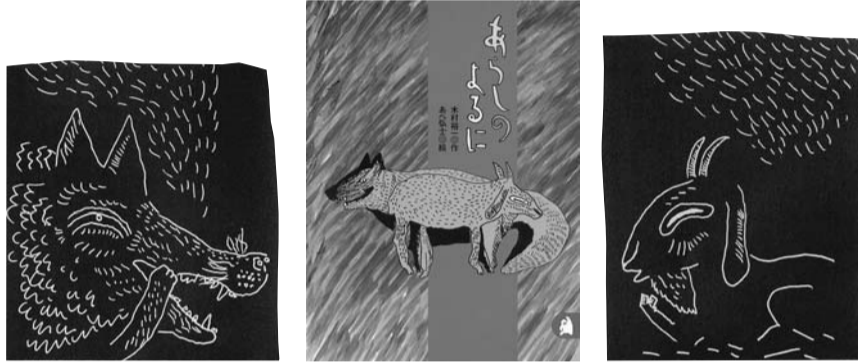
〈あべ弘士プロフィール〉

25年にわたる動物園飼育係としての経験やアフリカ、シベリアなどへの旅を通して、どのようにして絵を描くようになったかを、お話していただきます。どうぞご期待ください。また、美しい原画のDVDとともに、船越ゆかりさんによる『あらしのよるに』の朗読をお楽しみください。