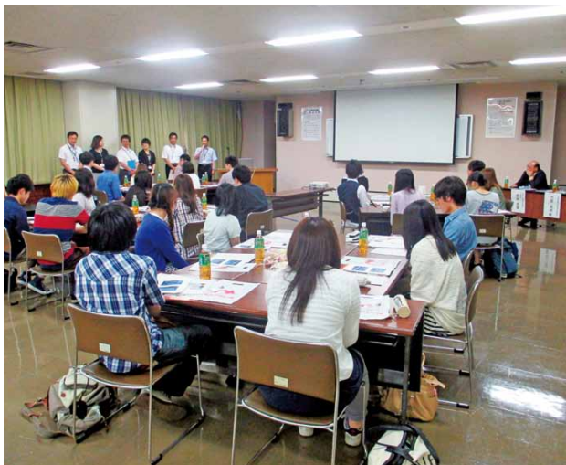
キックオフ・ミーティングでオリエ