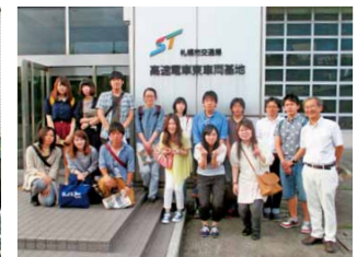
普段見ることのない車両基地の様子に学生たちは興味津々。