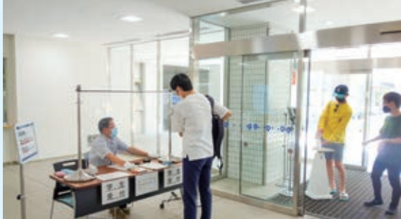
C館入口：受付を設け、来学した学生は学生証を提示し、来学記録を残しています。手指消毒やマスク着用の徹底も行っています。

このような中、全学生が遠隔授業を自宅でもスムーズに受講できるよう、パソコンやインターネット環境の整備のために、 学生1人当たり