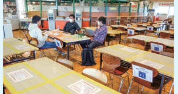
大学生協の食堂：間隔を空けて席に座るようにテーブルやイスにサインを設置しました。