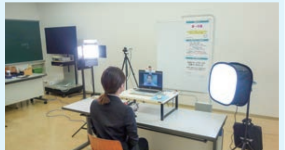
就職支援課でのオンライン面接の様子：必要な設備を学内に整えました。