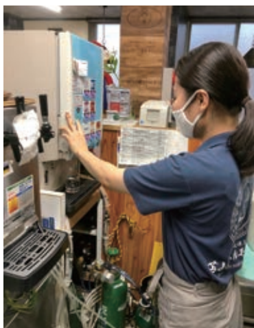
アルバイト頑張っています

同窓会奨励生として今回選んでいただき、とても感謝しております。奨励生としての自覚と責任を持ち、短大の学びをしっかり行い、多くのことを身につけて卒業したいと考えています。また、卒業後も同窓会活動に積極的に参加し、同窓生の方と思い出を共有し親睦を深めたいと思います。同窓会ならではの職場や世代を超えての交流や出会いの中で、色々な考え方に触れ、視野を広げていきたいです。そこから、自分の将来に対する見方や価値観も変わってくると考えます。そして、この同窓会奨励生制度についても、学業に励むことのできる制度としてより多くの学生に知ってほしいと願っています。