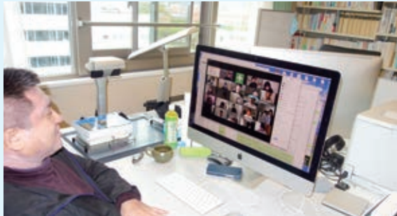
研究室からオンラインで授業配信。約70名の学生が出席しました。