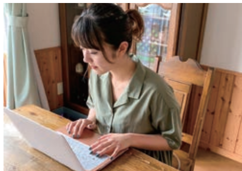
将来の夢に向かって勉学に励んでいます

この度は、同窓会奨励生に採用していただき誠にありがとうございます。奨励生としての自覚を常に持ち、自分の役目を果たしたいと思っております。同窓会懇親会などのイベントに積極的に参加することは勿論、本学の同窓会が私たちが在学のために支援してくださっていることを理解し、それを広めるのと同時に北星学園大学の魅力も広めていきたいと考えています。同窓会活動に参加した際には、人との関わりを大切にコミュニケーションをたくさんとりたいです。また、様々な年代の方との交流を深め、多くの知識を身に付け、将来に活かしたいです。