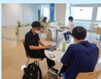
学内でオンライン授業の課題に取り組む学生たち

賜りました寄付金は、学生への緊急支援「通信環境整備等支援金」の給付事業の財源として用いさせていただきます。