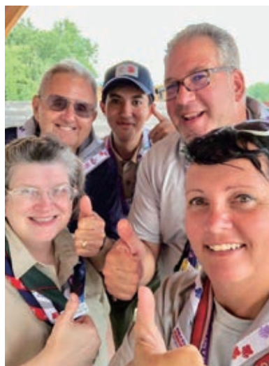
世界ジャンボリーでの海外のボーイスカウトとの交流

この度は、同窓会奨励生に選考していただき、誠にありがとうございます。奨励生という立場に自覚と責任を持ち、自分にできることを精一杯やらせていただきたいと思っております。私は16年間ボーイスカウト活動に参加しており、キャンプや奉仕活動を行ってきました。その中でも特に印象に残っているのが二度参加した世界ジャンボリーです。これは世界中から約5万人のボーイスカウトが集まり約二週間のキャンプ生活を共にする大会で、つたない英語を使いながらも海外の仲間と交流する楽しさを知ることができました。私は学内でEASCOMとHOKUSESSに所属し、留学生との交流プログラムを企画・運営しています。今後は、本学の同窓会が私たち学生にどのような支援をして下さっているのかについて、留学生にも伝える活動をしていきたいです。