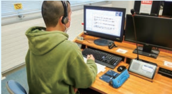
オンライン授業を大学内のCALL教室等で授業を受ける学生。