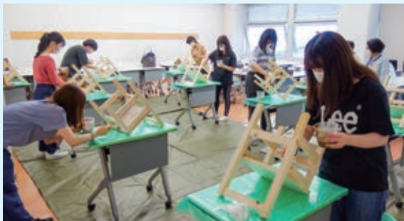
7月から一部対面授業が始まりました。フィールド実習の様子。