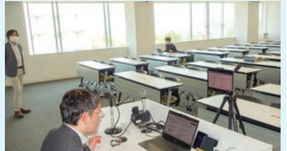
短大部のアセンブリの授業。複数の教員が協力し、大学の教室から配信しました。