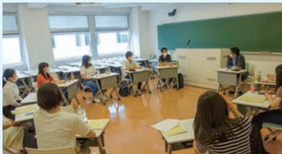
対面でのゼミ授業：窓を開け、机の間隔を取っています。