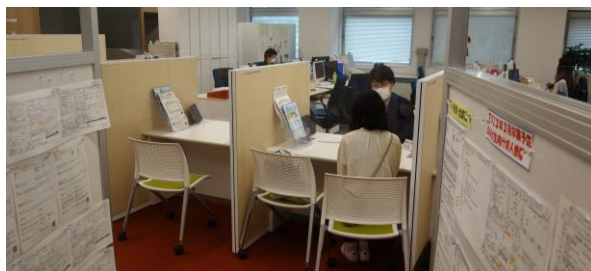
2022年7月 就職支援課での相談の様子

個別面談と並行して、お子様の就職相談を 就職支援課で行います。 就職支援課職員がお待ちしておりますので お気軽にご相談ください。